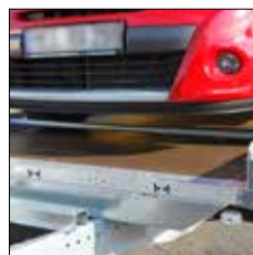
Radanlaufprofil wheel stopper bar