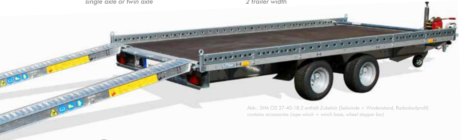
Abb.: SHA O2 27-40-18.2 enthält Zubehör (Seilwinde + Windenstand, Radanlaufprofil) contains accessories (rope winch + winch base, wheel stopper bar)