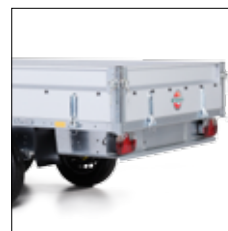
Bordwand side panels