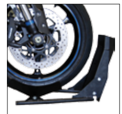
Radhalterwippe cradle-style wheel holder