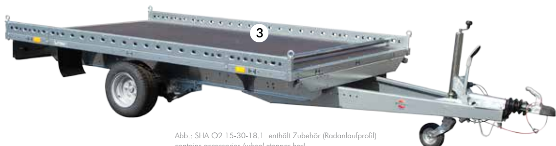
Abb.: SHA O2 15-30-18.1 enthält Zubehör (Radanlaufprofil) contains accessories (wheel stopper bar)

zul. Gesamtgewicht (kg) gross vehicle weight