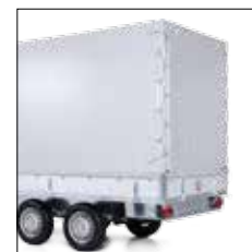
Hochplane + Spriegel high cover + high frame